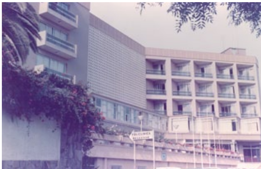
Hospiten Bellevue 1969 (Antiguamente denominada Policlínica Bellevue)

Además de estos doce centros médico-hospitalarios de alta complejidad el Grupo HOSPITEN cuenta con más de 100 centros ambulatorios