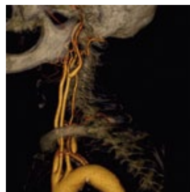
Pág.22 Imagen de la carótida obtenida mediante Tomografía Axial Computerizada