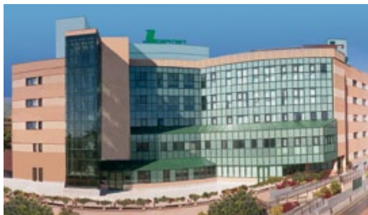
Hospiten Bellevue en la actualidad.

bajo la marca Clinic Assist, que completan una red asistencial con los mayores estándares de calidad internacionales.