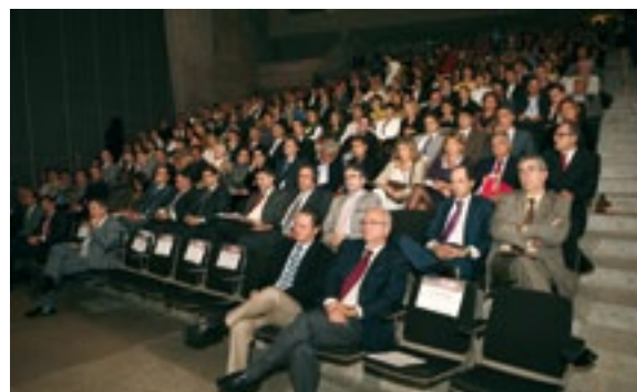
Asistentes al Foro de Internacionalización

En todas las conferencias se explicaron las razones de dar el paso a la internacionalización, los inconvenientes que se encontraron en los primeros tiempos y las ventajas que han aportado a sus respectivas empresas el conseguir internacionalizar su actividad.