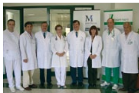
Parte del servicio médico de HOSPITEN Lanzarote durante la visita del Colegio de Médicos

El resultado de esta acción fue exitosa ya que cubrió con creces los objetivos de las partes implicadas, siendo sumamente satisfactoria tanto para el Colegio, el colectivo médico de HOSPITEN y el propio hospital, HOSPITEN Lanzarote.