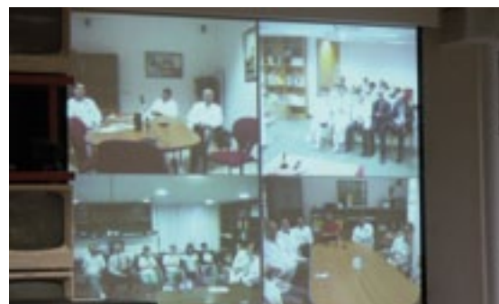
Panel de videoconferencia entre los diferentes centros del Grupo HOSPITEN

Dichas sesiones se impartirán cada quince días los jueves a las 8:30 y se transmiten a las salas de videoconferencias de HOSPITEN Bellevue, HOSPITEN Sur, HOSPITEN Rambla, HOSPITEN Clínica Roca, HOSPITEN Lanzarote y HOSPITEN Estepona.