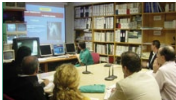
Biblioteca de HOSPITEN Rambla