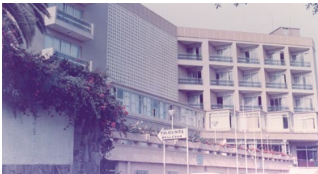
Pág.4. Hospiten Bellevue 1969