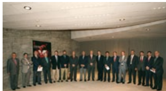
Ponentes y organizadores del III Foro de Internacionalización