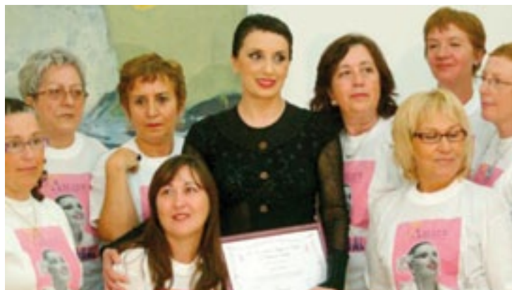
Luz Casal y mujeres de la asociación Amate