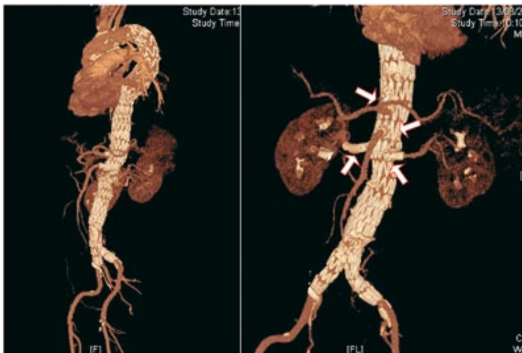
Imagen de TAC donde se observa las cuatro fenestraciones y los diferentes stend en la aorta

Un aneurisma de aorta, es una dilatación en dicha arteria en un punto determinado, este tipo de patología implica un riesgo de rotura de la misma lo que conlleva una alta mortalidad, más del 90%, de no haber sido tratada con antelación. La única manera de tratamiento de la misma es mediante intervenciones quirúrgicas ya sean tradicionales, abiertas, o bien endovasculares, que se caracterizan por la introducción de catéteres a través de las arterias del cuerpo y la implantación de prótesis flexibles dentro de la aorta.