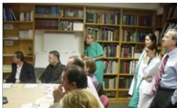
Asistentes al curso práctico en el manejo de la Aorta