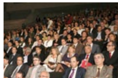
Pág.11. Asistentes al III Foro de internacionalización celebrado en la Isla de Tenerife