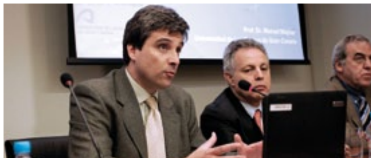
Momento durante la presentación del proyecto MOTIVA

A partir de las capacidades actualmente a disposición del grupo, aprovechando las oportunidades ofertadas por la rápida expansión de la cirugía de mínima invasión y las tecnologías emergentes (aplicaciones basadas en computador, tecnologías de la información y las comunicaciones, biomateriales, nanotecnología, nuevos procesos de fabricación, formación, etc.) y con el propósito de dar respuesta a las necesidades de cambios en un entorno sanitario que a menudo se resiste (en ámbito regional, nacional y global), se propone poner en marcha este plan que originalmente incluye: